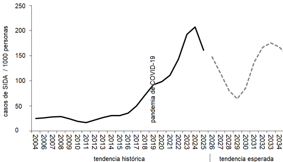
Figura 1. Tendencia histórica 2004-2025 y esperada del SIDA 2026-2034 para el estado de Oaxaca.

En este trabajo se detectó una mayor demografía de personas viviendo con SIDA en la Región Costa (desde Santiago Pinotepa Nacional a la Cruccecita, Bahías de Huatulco) y entre Puerto Escondido y Bahías de Huatulco (Fig. 3). También se confirmó que el patrón demográfico del SIDA fue menor en las regiones Sierra Sur, Mixteca y Cañada, sin casos relevantes en las regiones de Valles Centrales, Sierra Norte y Papaloapan.