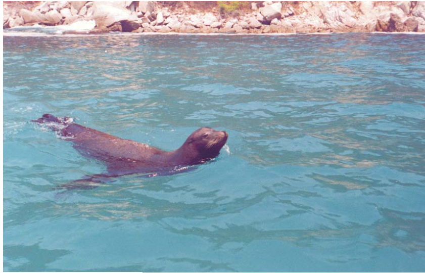
Fotografía 1. Imagen del ejemplar avistado.

porción clara en la frente del animal, no resultó muy evidente. El hecho de no presentar una mancha clara notable en la frente apoya la idea de que se trató de un ejemplar joven no dominante de Z. c. californianus .