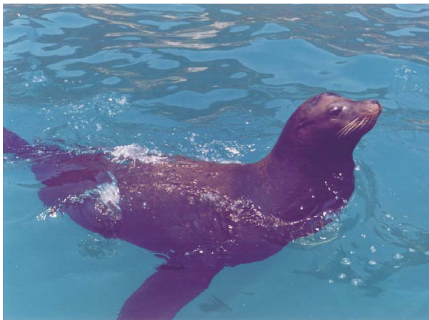
Fotografía 2. Imagen del ejemplar avistado.

En conclusión, la ocurrencia de este individuo en el Pacífico tropical debió favorecerse por la presencia de la corriente de California, que lo llevó hasta la costa central de Oaxaca. Su permanencia pudo facilitarse por la aportación de alimento por parte de los pescadores. A este respecto, es común observar a lobos marinos “limosneando” alimento (Jefferson y Leatherwood, 1995). Finalmente, la partida del organismo coincidió con su época reproductiva, en el tiempo en que la corriente de