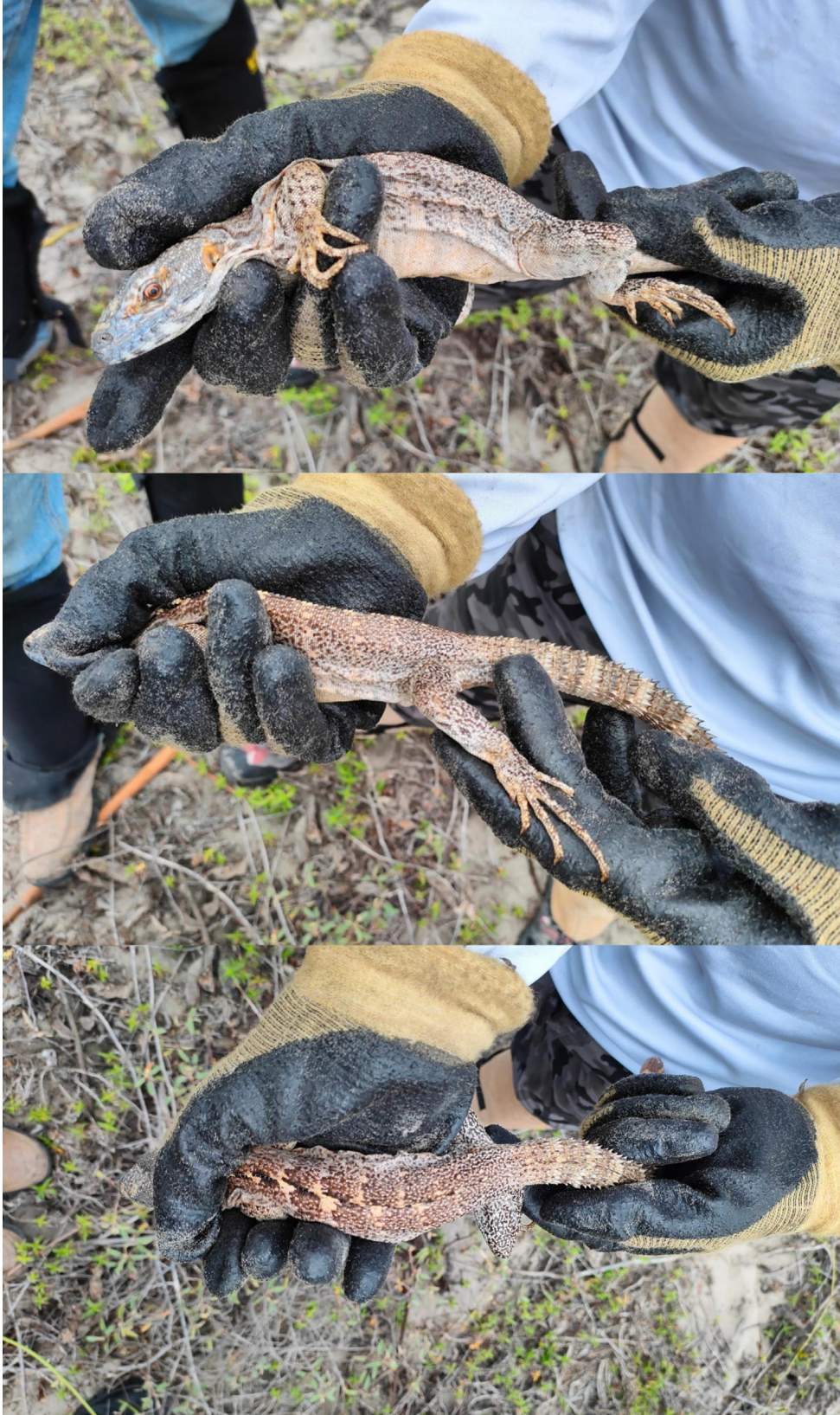
Figura 2. Individuo de Ctenosaura macrolopha encontrado en Isla Quevedo, Sinaloa, México (Fotografía: Walfredo Ávila Chancellor).