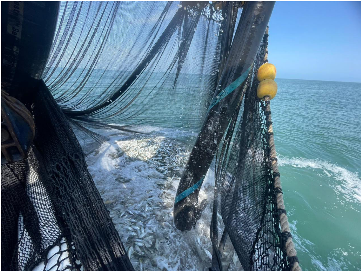
Figura 1. Pesca de sardina en el Golfo de California (Fotografía: Roberto Vallarta Zárate).

Para ayudar en esta tarea, los científicos que trabajan en el área de las pesquerías utilizan varias herramientas, entre las más conocidas están la genética y el uso de mediciones del cuerpo de los peces.