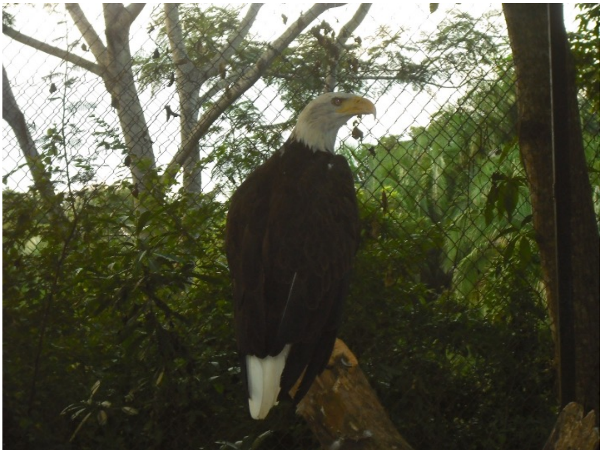
Figura 1. Águila cabeza blanca en San Juan Bautista Tuxtepec, Oaxaca, México, las fotografías corresponden a ocho años después de su ingreso a UMA Sockeye

municipio (18°00'33.32" N, y 96° 10'20.75" W a 36 m.s.n.m.). El tiradero, actualmente se encuentra rodeado por áreas agrícolas, vegetación secundaria de selva mediana perennifolia y asentamientos humanos irregulares. El individuo fue capturado y entregado a las autoridades ambientales quienes la depositaron en calidad de resguardo en la Unidad de Manejo y Aprovechamiento de la Vida Silvestre "Sockeye" (registro INE/CITES/DGVS/CR-IN-589/OAX/99), administrada por el Instituto Tecnológico de la Cuenca del Papaloapan, municipio de San Juan Bautista Tuxtepec, Oaxaca. Con base en el patrón de coloración del plumaje e iris, se determinó como un individuo juvenil. Posteriormente, obtuvo su plumaje definitivo de adulto con el característico color