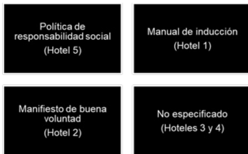
Figura 1. Documento rector de los hoteles. Elaboración propia (2023).

Con la información recopilada, se pudo identificar que de las tres formas de llevar a cabo esta directriz dentro los establecimientos hoteleros las que más destacaron fueron las sesiones de sensibilización y capacitación a través del apoyo de instituciones y organismos expertos y con la